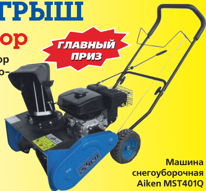
Машина снегоуборочная Aiken MST401Q

Количество акционного товара ограничено! Все цены и скидки указаны в рублях, включают в себя НДС и действительны с 6.11.2010 по 16.01.2011 г. Скидки по акциям не суммируются.